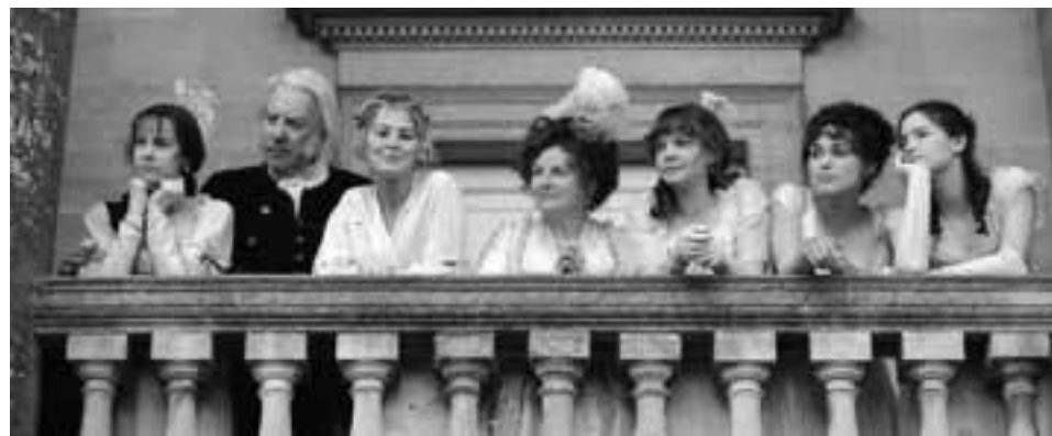
Экранизации романов Остин — кадры из фильмов

жизни писательницы были изданы четыре ее романа: «Разум и чувства», «Гордость и предубеждение», «Мэнсфилд-парк» и «Эмма». В 1818 году посмертным изданием вышли «Нортонгерское аббатство» и «Убеждение».