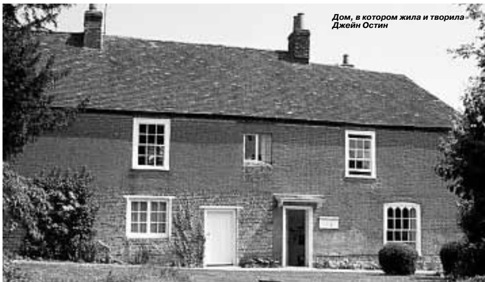
Дом, в котором жила и творила Джейн Остин